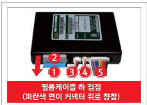
필름케이블 하 접점 (파란색 면이 커넥터 위로 향함)

트립컴퓨터 장착 및 배선 체결 : 트립컴퓨터를 오디오에 고정하고 배선을 체결합니다