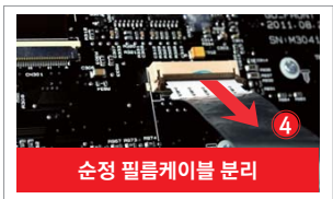
순정 필름케이블 분리