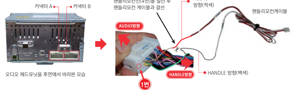
오디오 헤드유닛을 후면에서 바라본 모습